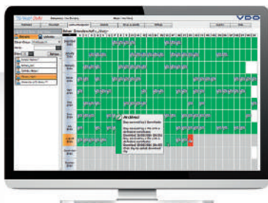
TIS-Web® Data Management (DMM)