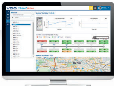
TIS-Web® Motion Tire Management