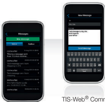
TIS-Web ® Communicator

Asimismo, puedes ofrecer asistencia a tus conductores con una lista predefinida y personalizable para la realización de controles previos a la salida. La lista de comprobaciones (con comentarios si es necesario) se puede transmitir a TIS-Web ® Web incluyendo fotos antes del inicio de un viaje.